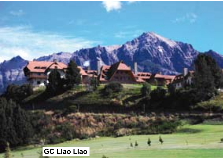
GC Llao Llao