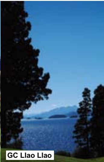
GC Llao Llao