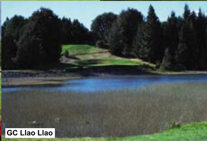
GC Llao Llao

Südlich von Bariloche liegt nach einer Fahrzeit von rund einer halben Stunde ein weiterer Golfplatz, der Golf- und Country Club Arelauquen, was auf indianisch wegen der Quellen warmes Wasser bedeutet. Ein riesiger Adler begrüßt den Gast in der Lodge, in der man direkt am Golfplatz Quartier beziehen kann. Sie ist ebenfalls mit 5 Sternen ausgezeichnet, aber kleiner und uriger als das Llao Llao Hotel. Es ist sehr geschmackvoll und gemütlich mit hübschen Möbeln eingerichtet. Das unweit liegende Clubhaus ist ebenfalls sehr ansprechend und im Pro-Shop gibt es neben vielen Golfartikeln auch alles rund ums Polospiel zu kaufen. Das Clubgelände Arelauquen bietet nämlich unzähligen Polopferden Quartier und während der Spielsaison ist hier an den Wochenenden auf beiden Spielfeldern mächtig was geboten. Zum Skigebiets Cerro Cathedral sind es nur 10 Minuten Fahrzeit und mit 20 Liften sind die ca. 2500 Meter hohen Berge voll erschlossen. Nicht umsonst trainiert so manche europäische Ski-Nationalmannschaft während unserer Sommermonate hier. 280 sehr hübsche Ferienhäuser sind auf dem rund 300 Hektar großen Gelände erbaut und viele reiche Familien aus Buenos Aires verbringen hier sowohl im Sommer als auch im Winter ihre Ferien.